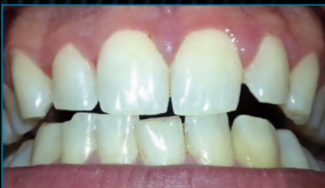
Klinisches Ergebnis nach 3 Wochen. Die erzielte Farbe ist Vita A1