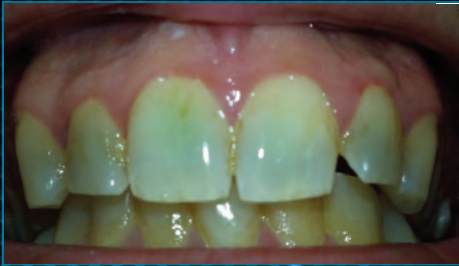
1. Tag Ausgangsfarbe A3 VITA* Farbskala