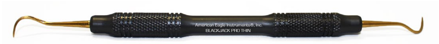
AE SBJT XP X

Ein ProThin Instrument mit XP Technologie für präzises interproximales Arbeiten an einem Prämolaren. Blackjack ProThin ist universell einsetzbar auch im UK-Frontbereich.