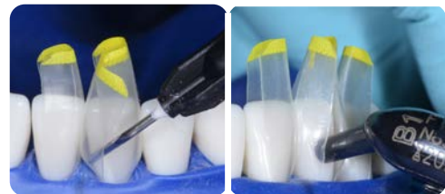
6 Adhäsion, Material applizieren, Lichthärten, Matrizen entfernen, Restauration fertigstellen