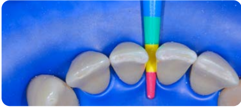
1 Grösse messen