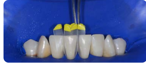
4 Matrizen einpassen