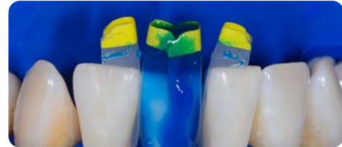
5 Ätzen und spülen