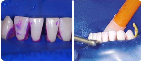
2 Offenlegen und reinigen